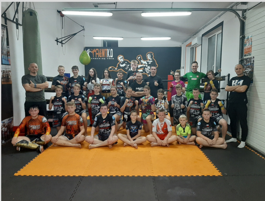
sparings w Obrowie