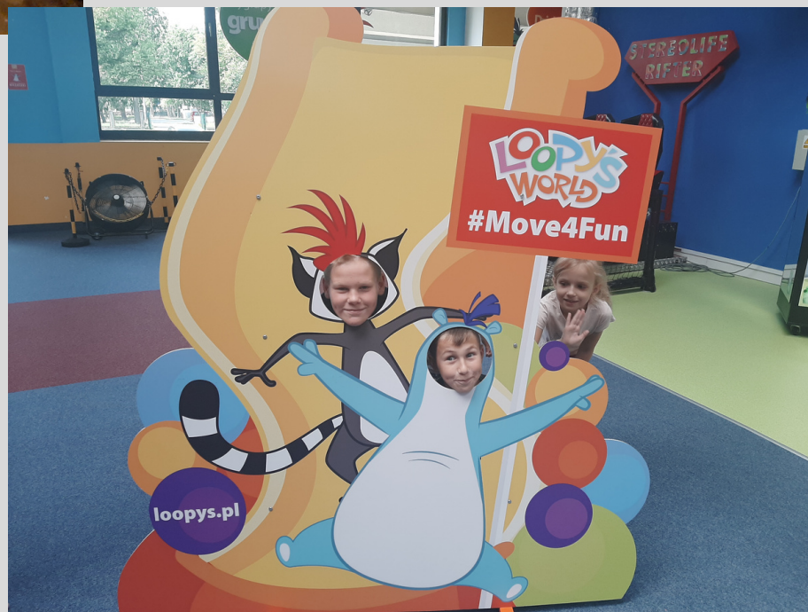
wyjazd na gale DFN do Gdańska