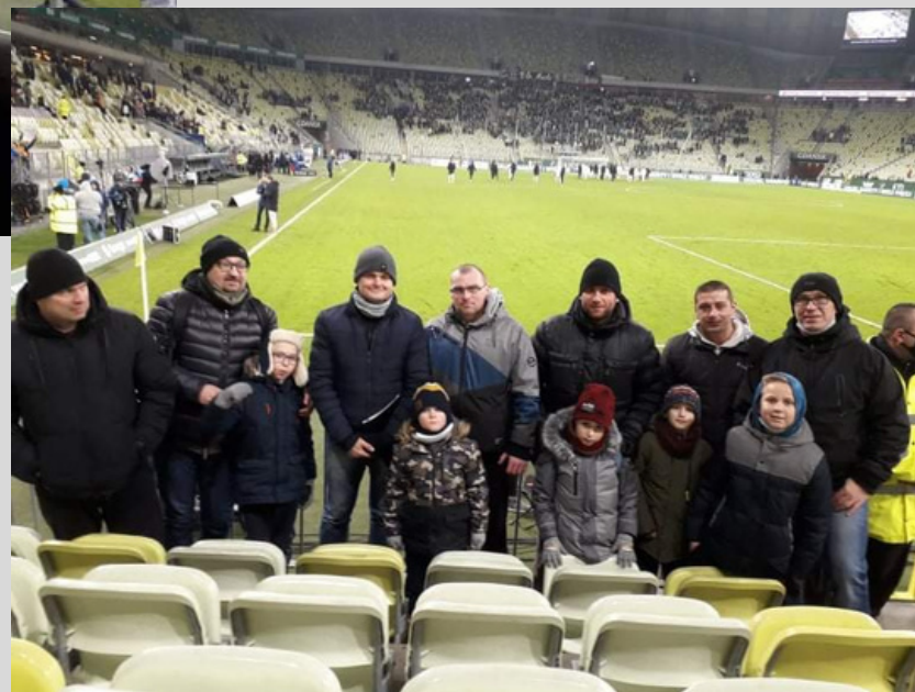
mecz ekstra klasy w Warszawie