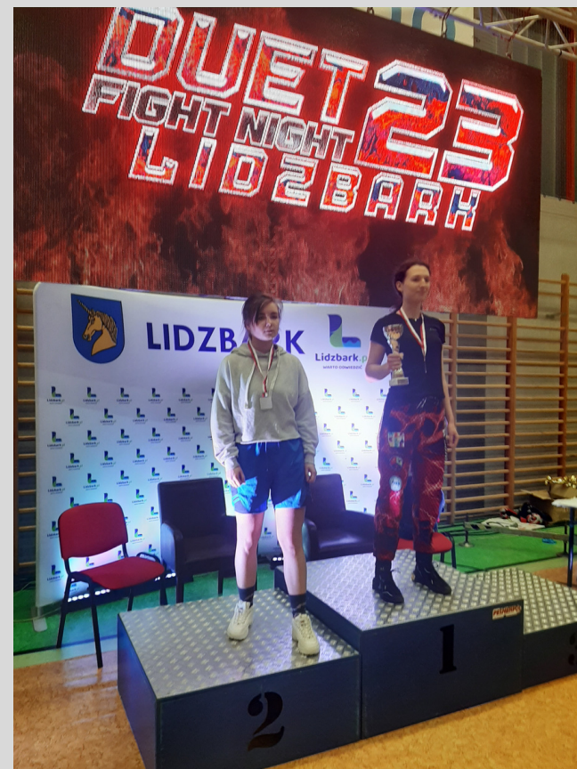
zawody w Lidzbarku