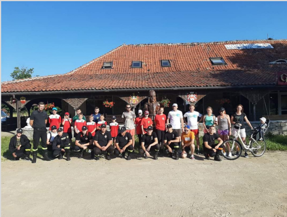
ultra marzenie dla Kubusia