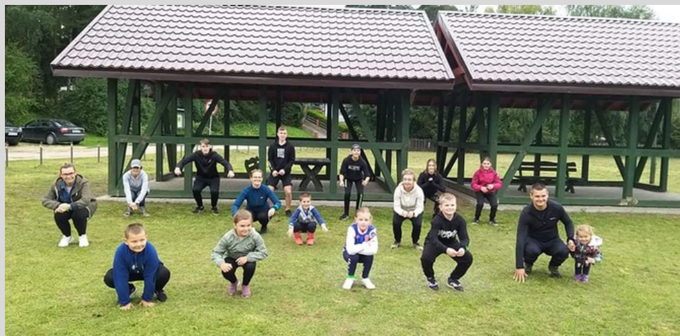
Rodzinny Rajd Rowerowy