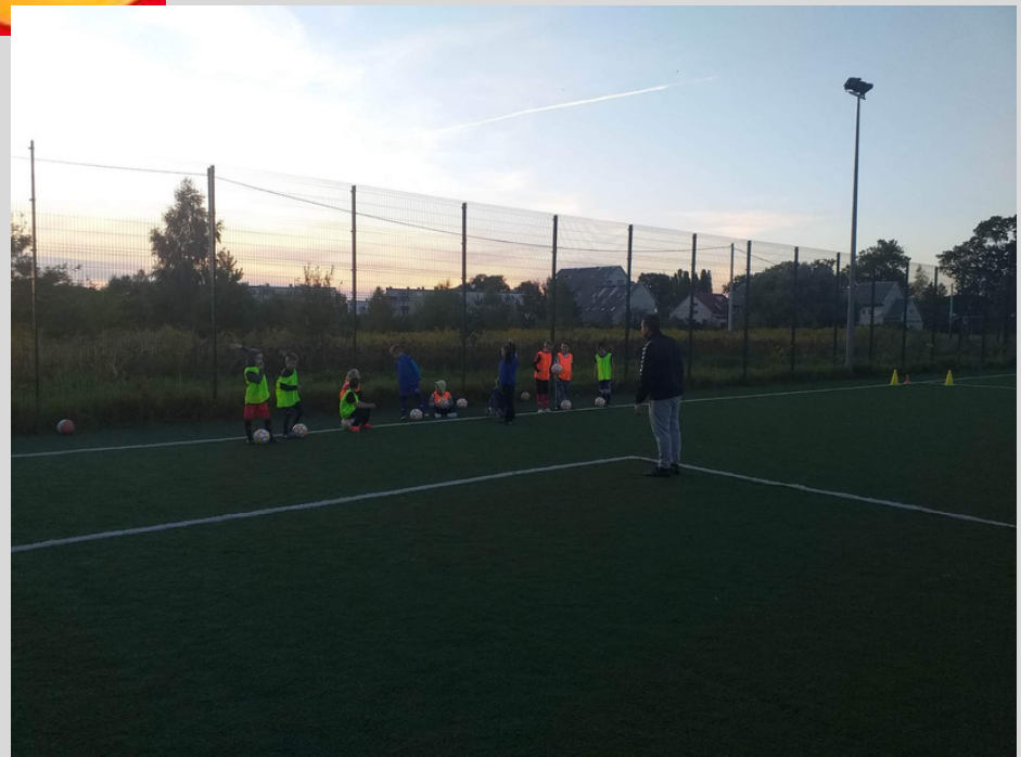
Mobilna Akademia Młodych Orłów