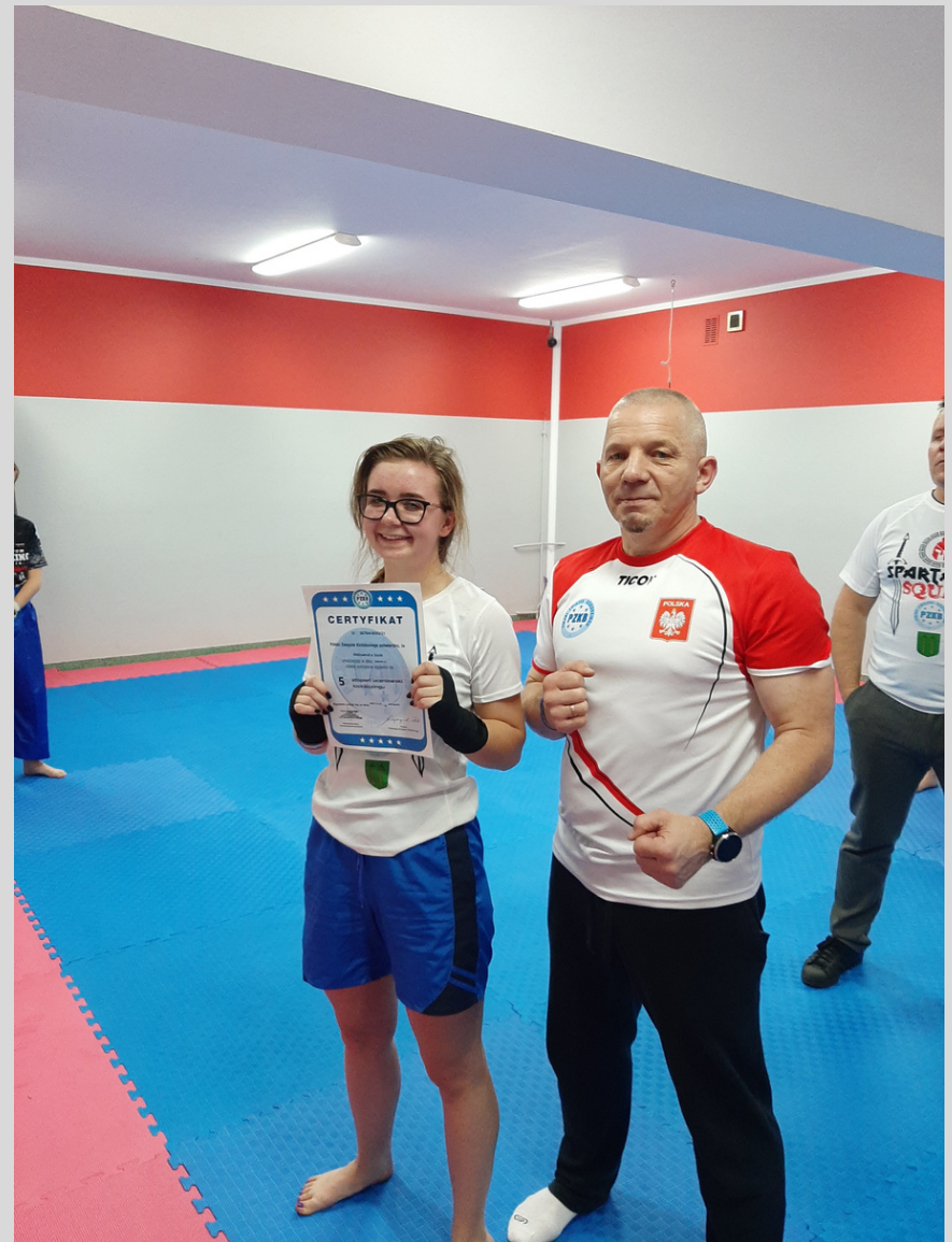
współpraca z klubem Spartakus Squad