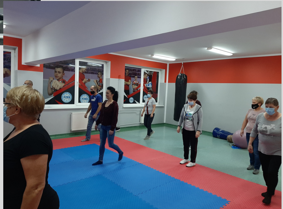
zajęcia dla Pań na siłowni i zajęcia dla seniorów