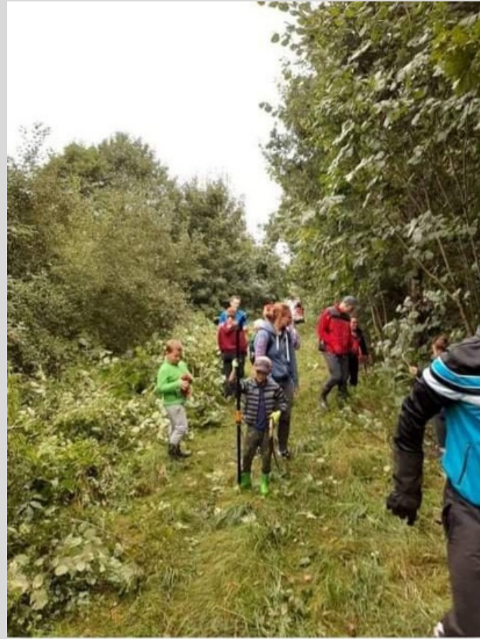
oczyszczanie ścieżki rowerowej