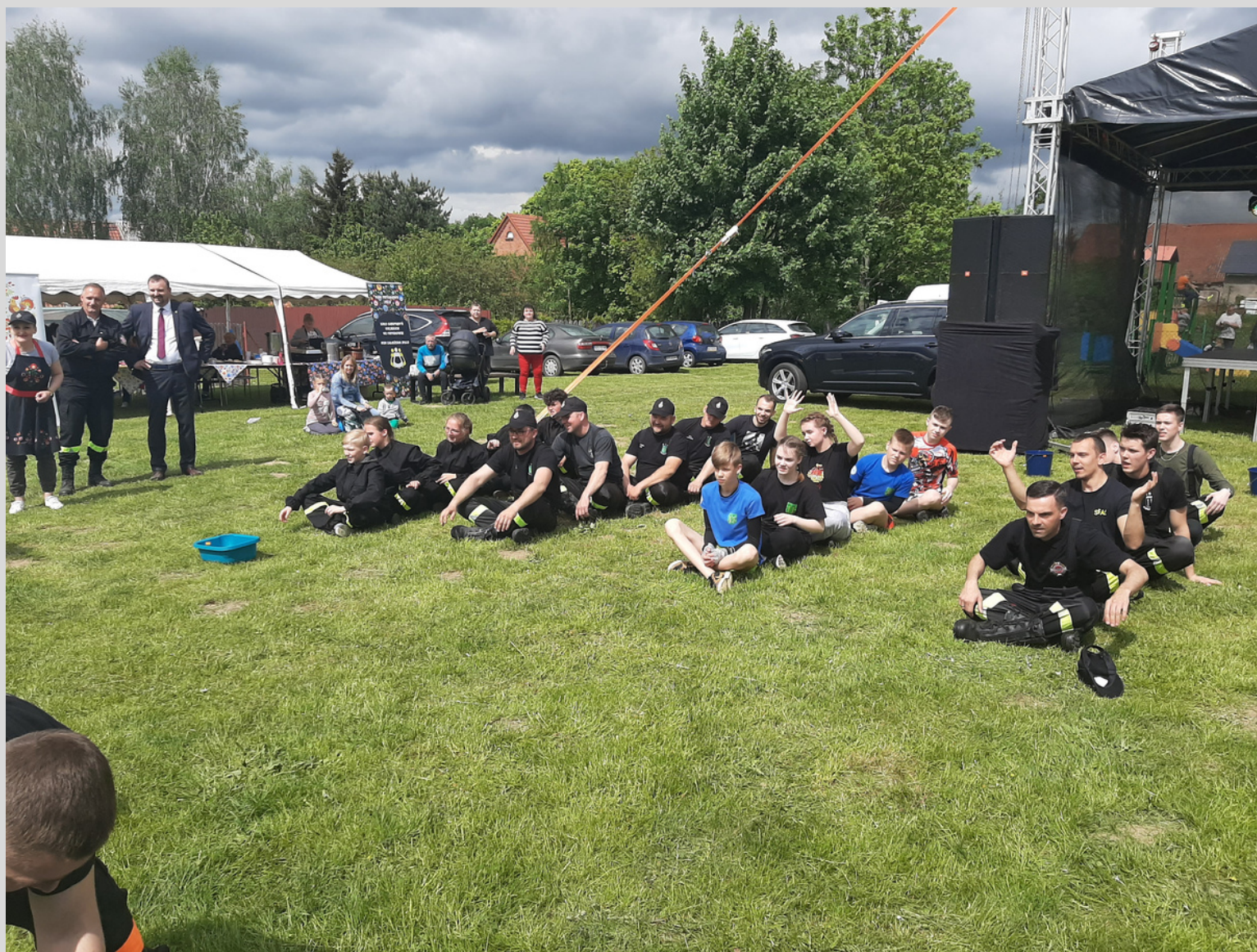
Dzień Dziecka i Dzień Strażaka w Rychnowie